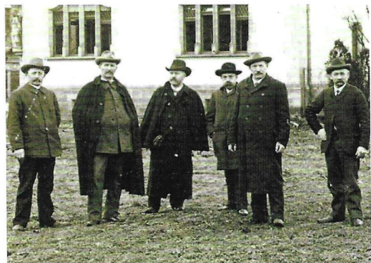
Bürgermeister Karl Westermann. (2. von rechts)

Nahezu jede Gemeinderatssitzung begann mit der Zustimmung zu Ausgaben der Gemeinde, die aus laufenden Zahlungsverpflichtungen oder als einmalige Zahlungen für Anschaffungen oder Leistungen fällig wurden. Mehr als sparsam waren die Gemeinderäte. Laufende neue Zahlungsverpflichtungen einzugehen vermieden sie, wenn immer nur möglich. Beispiele dafür sind: 5